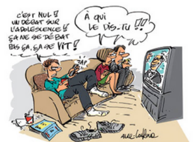
MODULE 1 "L'adolescence, une question de dosage"